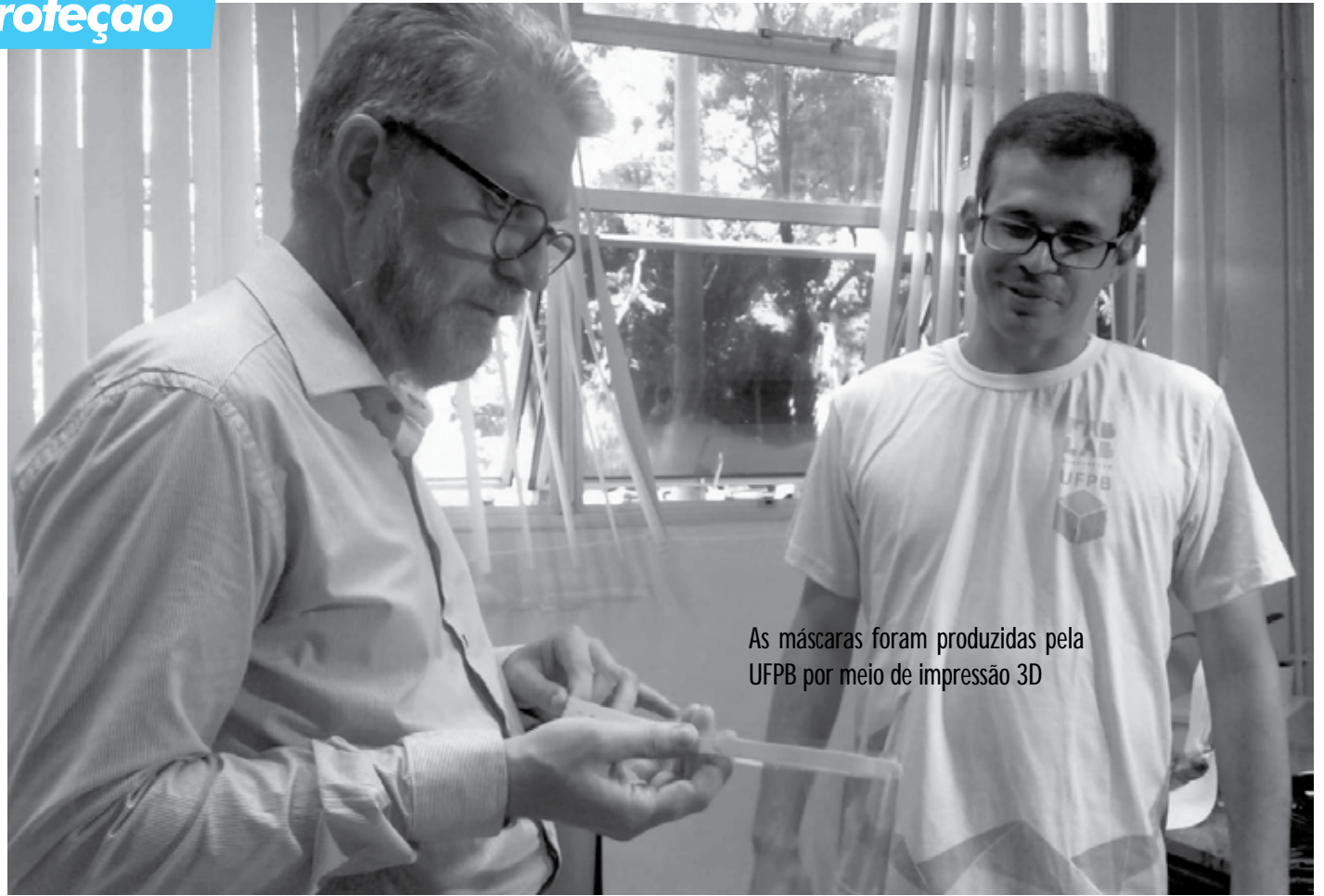
As máscaras foram produzidas pela UFPB por meio de impressão 3D