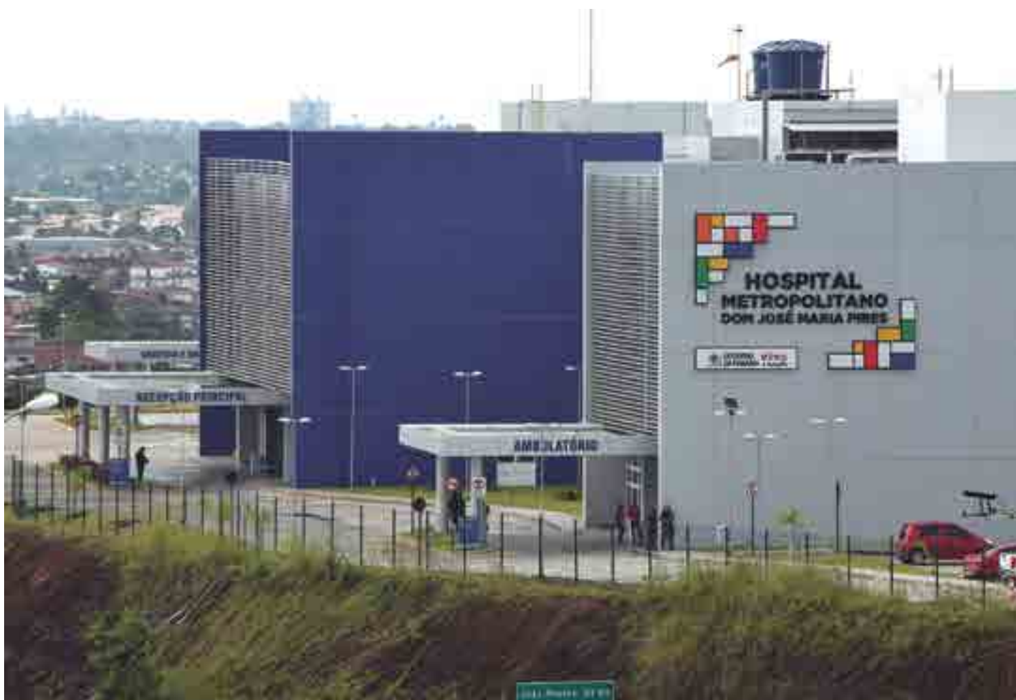
Estrutura será montada no estacionamento do Hospital Metropolitano e poderá chegar a 200 leitos, caso haja uma demanda maior que a esperada