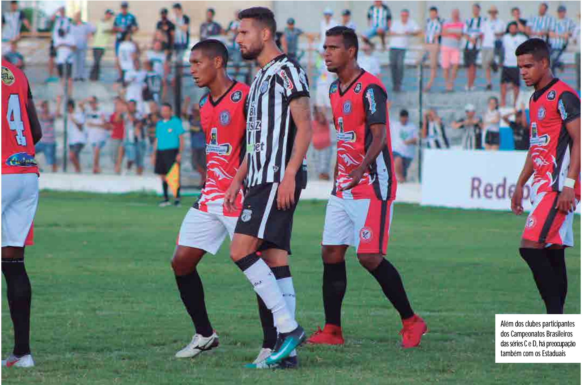
Além dos clubes participantes dos Campeonatos Brasileiros das séries C e D, há preocupação também com os Estaduais