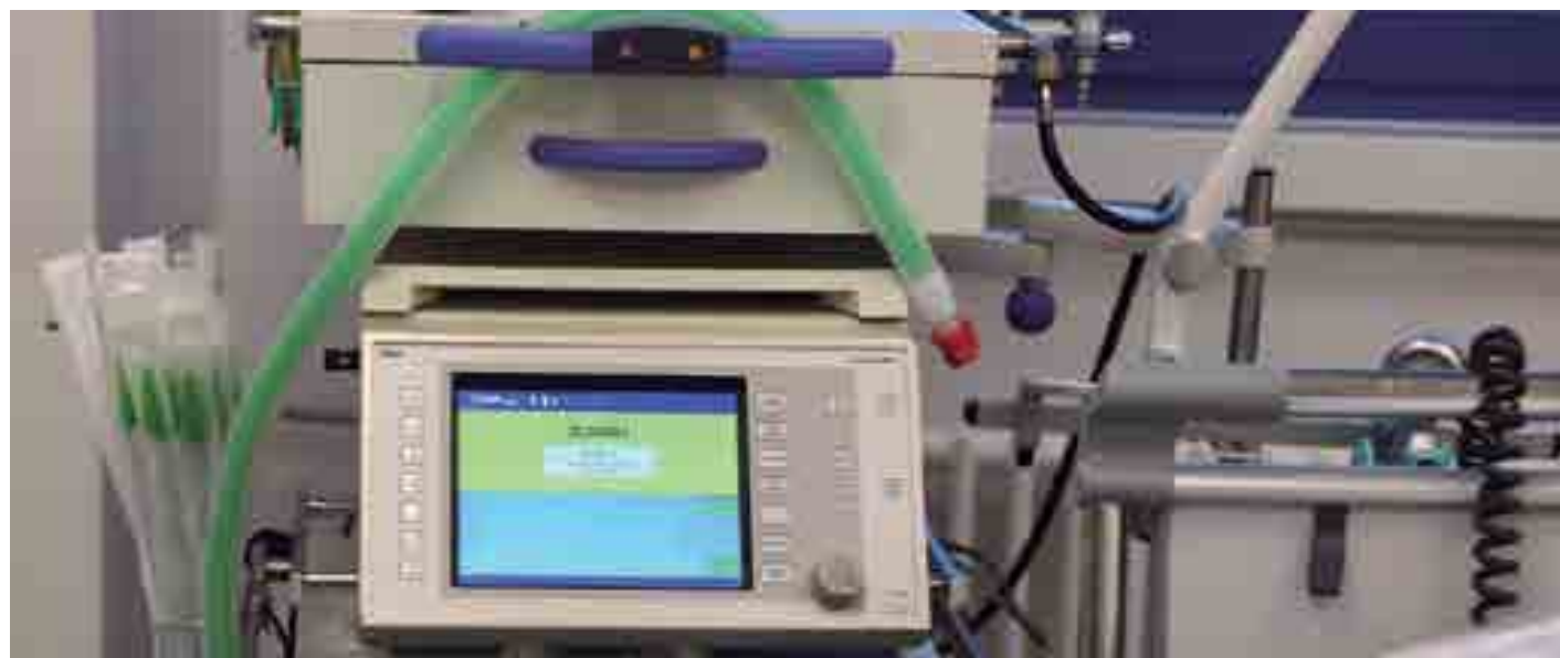
Paraíba receberá aparelhos respiradores considerados essenciais para tratamento e recuperação de pacientes que estão com Covid-19

As aquisições fazem parte do plano estadual de enfrentamento do novo coronavírus, que se estende a compra de 89 respiradores e a chegada de novos equipamentos do Ministério da Saúde (MS) para dar suporte aos pacientes da Covid-19 que precisarão de atendimento médico, seja em leitos de enfermaria ou de Unidade de Terapia Intensiva (UTI).