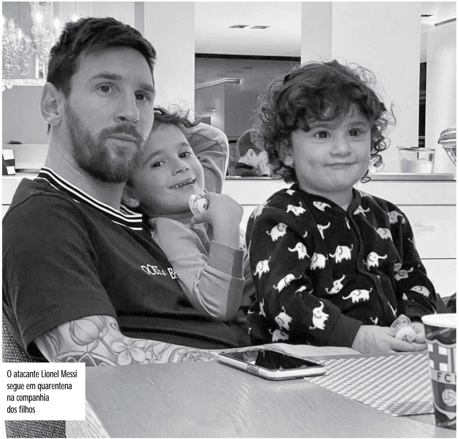
O atacante Lionel Messi segue em quarentena na companhia dos filhos

O clube anunciou na semana passada que irá aplicar este ERTE, que consiste na redução da jornada de trabalho e do salário, devido a suspensão do futebol causada pela pandemia do coronavírus na Espanha, onde o governo decretou o Estado de Emergência até 11 de abril.